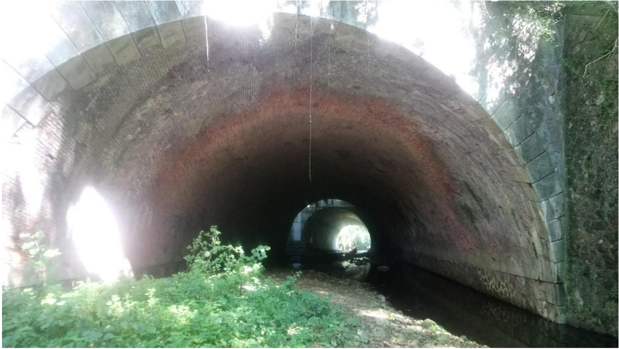
Photographie 1 du 08/11/2021 : Vue complète de l'ovoïde sous la RN7.