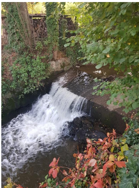
Photographie 3 du 08/11/2021 : photo du seuil Froget prise depuis l'aval de la chute.