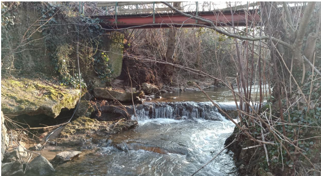
Photographie 4 du 08/11/2021 : vue de la chute induite par le seuil de la conduite EU